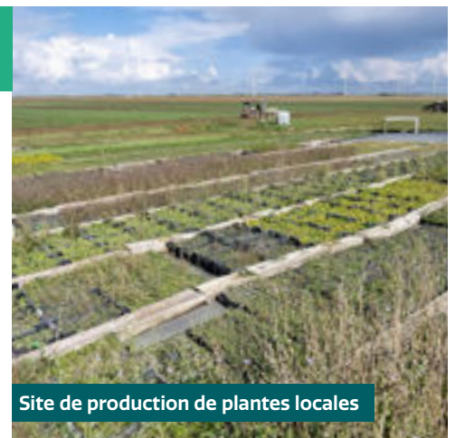
Site de production de plantes locales

Solution adaptable à la pente jusqu'à 60 %.